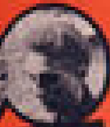
JEAN-BÉDARIDE MINISTRE DES AFFAIRES ÉTRANGÈRES