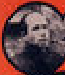
CHARLES DE GAULLE PRÉSIDENT DE LA RÉPUBLIQUE