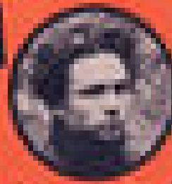
JEAN-BÉDARIDE MINISTRE DES AFFAIRES ÉTRANGÈRES