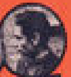
JEAN-BÉDARIDE MINISTRE DES AFFAIRES ÉTRANGÈRES