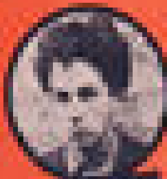
RENÉ COTY PRÉSIDENT DE LA RÉPUBLIQUE