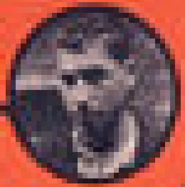
RAYMOND LEMAIRE MINISTRE DES AFFAIRES ÉTRANGÈRES