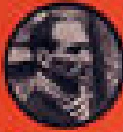
RENÉ COTY PRÉSIDENT DE LA RÉPUBLIQUE