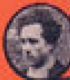
RAYMOND LEMAIRE MINISTRE DES AFFAIRES ÉTRANGÈRES