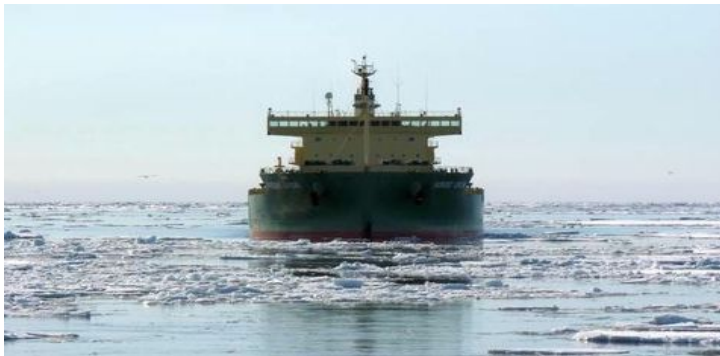
L’ouverture du passage du Nord-Ouest témoigne de conditions historiques inédites

Ce travail s’accorde avec le souhait du philosophe Cornelius Castoriadis qui en 1987 face à l’impasse écologique dans laquelle se trouvait prise la vie terrestre écrivait : « Nous n’avons pas besoin de quelques sages. Nous avons besoin que le plus grand nombre acquière et exerce la sagesse. »